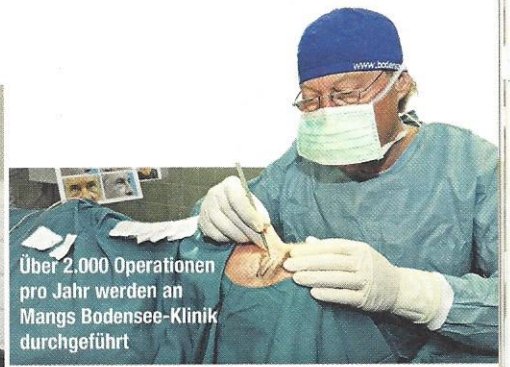
Über 2.000 Operationen pro Jahr werden an Mangs Bodensee-Klinik durchgeführt