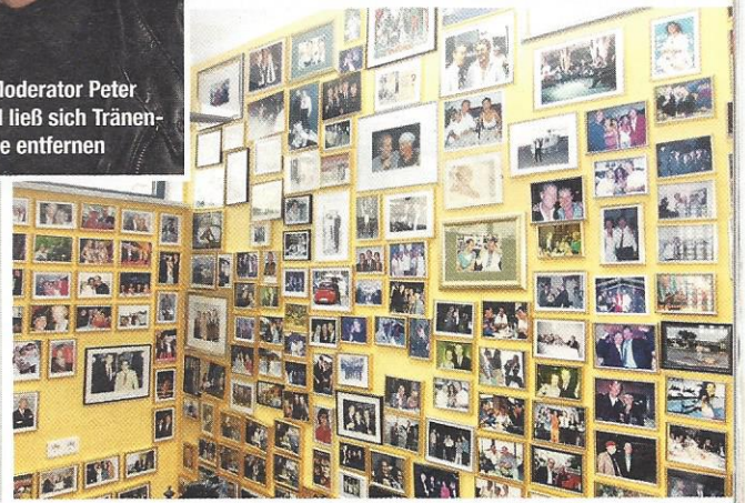
In Mangs Arbeitszimmer hängen Hunderte Bilder von prominenten Freunden an der Wand

fernen zu lassen, um eine enge Taille wie Victoria Beckham zu haben. Genauso Waden- oder Po-Implantate, um eine erotische Ausstrahlung zu haben. Das alles ist problematisch. Welche neuen Trends befürworten Sie?